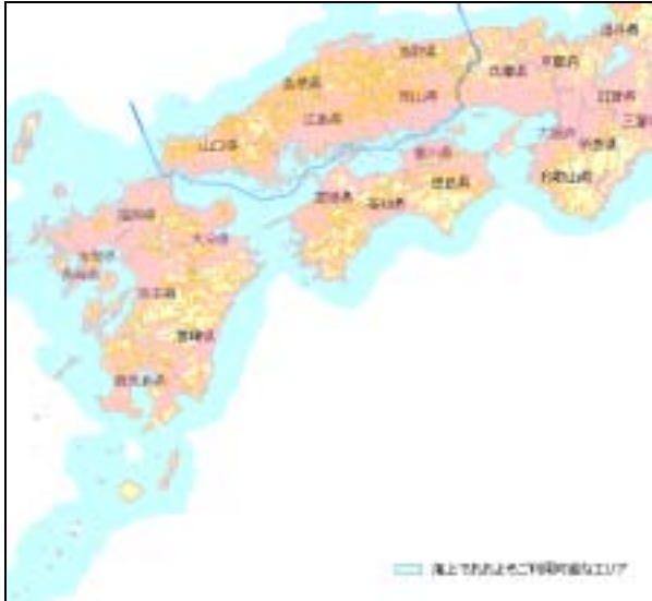
docomo HP 抜粋