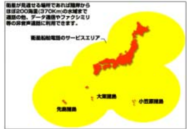
NTT HP 抜粋